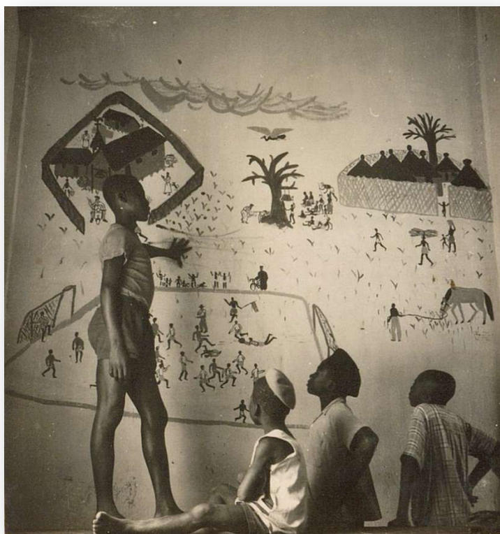
Mission de Fort Archambault-1955